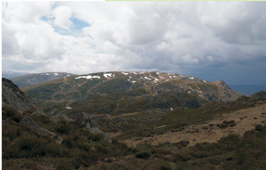
Cumes da serra Calva