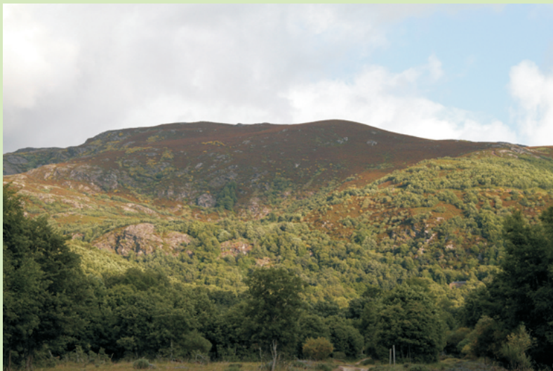
A serra Calva vista desde A Morteira

Recoméndase ir primeiro ás lagoas e logo baixar á Morteira.