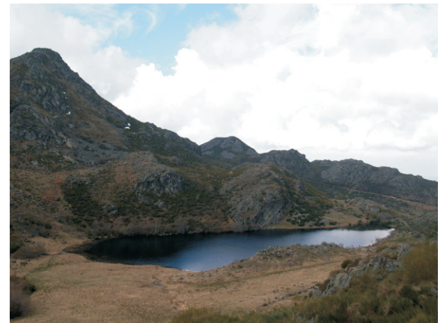
Lagoa do Ocelo

O val da da Morteira é produto da acción glaciá. Está situado nas abas occidentais da Serra Calva, coroado polo Sextil Alto (1.757 m) e os Altos a Corraliza. Está incluído no LIC PENA TREVINCA e valado como coto privado de caza maior.