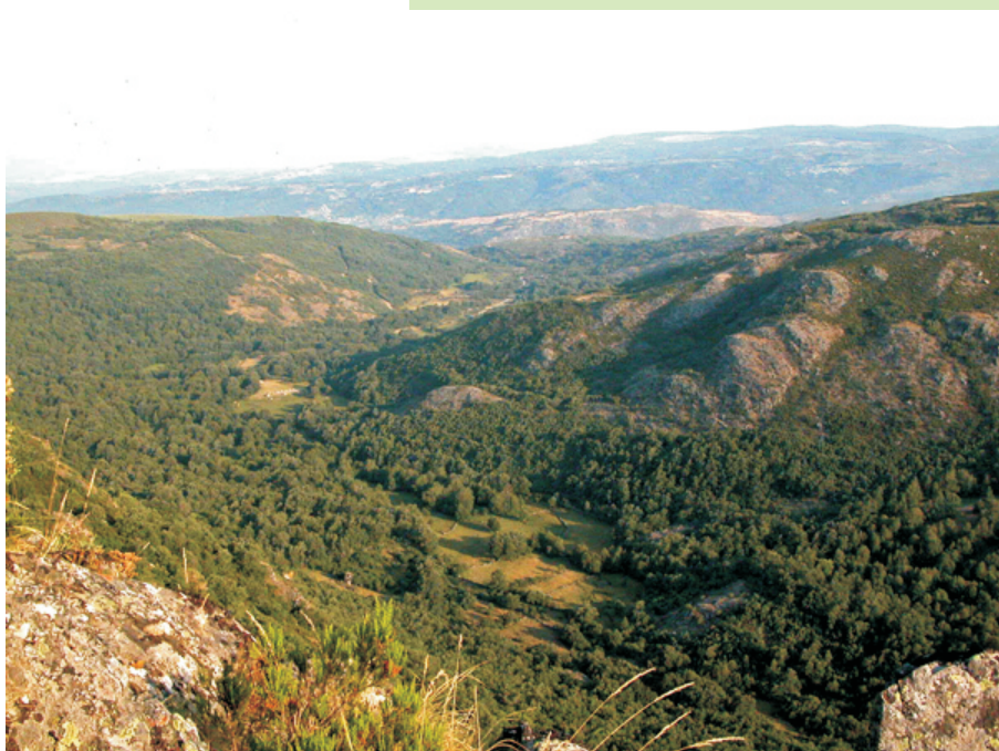
O val da Morteira desde os cumes