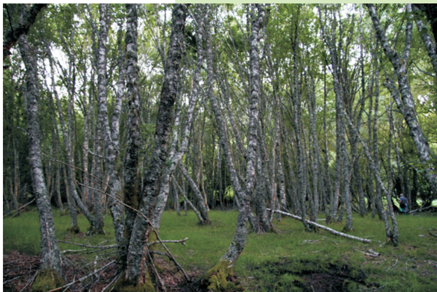
Bosque de bidueiros no fondo do val da Morteira