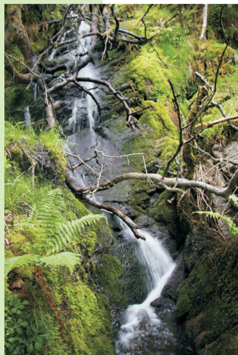
Fervenza no rego do Cavorco